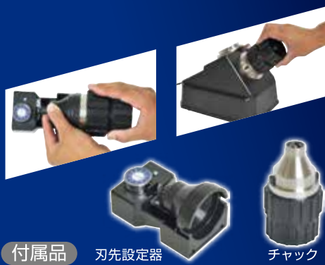
付属品 刃先設定器