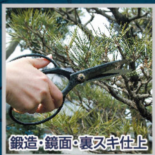
鍛造・鏡面・裏又半仕上