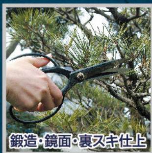
鍛造・鏡面・裏刃仕上げ