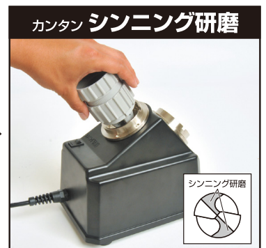
カンタン シンニング研磨