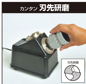
カンタン 刃先研磨