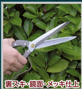
裏又キ・鏡面・メッキ仕上